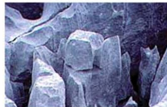
KARSTGESTEIN AM HOHEN IFEN