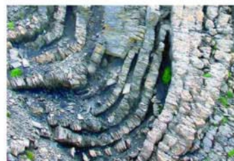
GEOLOGISCHE FALTE AM HOHEN IFEN